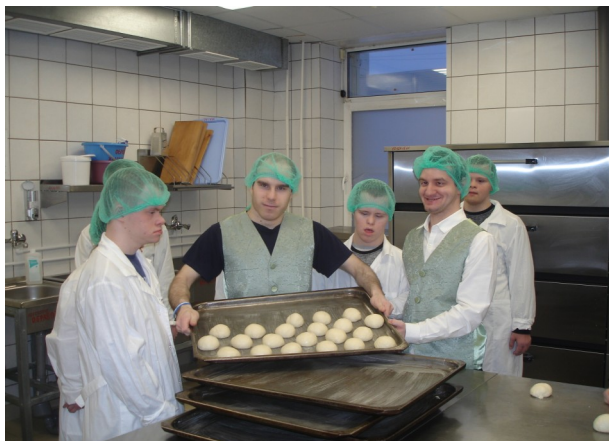
Экскурсия на пищеблок дома-интерната

В рамках реализации проекта были организованы виртуальные экскурсии из цикла «Социальные объекты города Мончегорска». В ходе таких онлайн-занятий воспитанники познакомились с объектами службы быта, торговли, предприятиями общественного питания, а также культурными